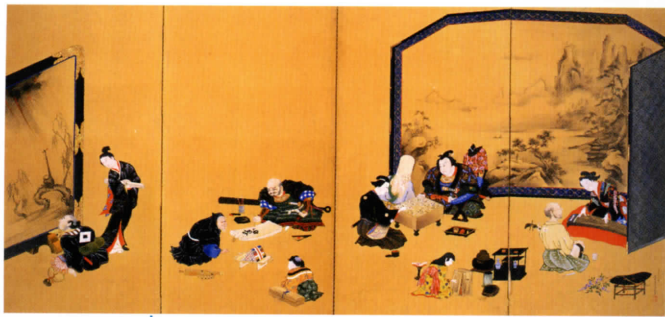
《碁棋書面図屏風》紙本着彩、四曲半双 大正元(1912)年 神奈川県立近代美術館蔵