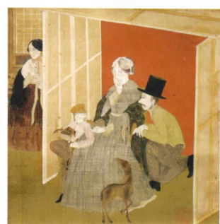
《阿蘭陀風俗図》文久3(1863)年頃 絹本着彩 東京藝術大学美術館蔵

しもおかれんじょう 下岡蓮杖(1823-1914年)は日本の写真開祖の一人。幕末に下田で生まれ、初め絵師を目指して狩野派に入門します。写真との出会いがその後の人生を大きく変えます。外国人写真師から機材と写場を引継ぎ、独学でその習得に努めました。横浜で写真師として成功を収めた後、浅草に移り住みます。進取の気性に富む蓮杖は、日本画のみならず、油彩画を含む絵画制作も続ける一方、石版画作品にも挑戦し、浄瑠璃を創作するなど、実に多彩な芸術活動を繰り広げました。