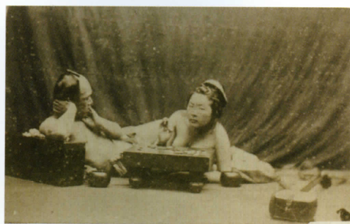
《間で囲碁を打つ男女》文久3年-明治9(1863-1876)年頃 鶏卵紙 東京都写真美術館蔵