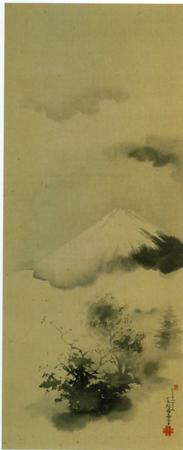
《芙蓉峰》明治36(1903)年 紙本墨筆 蓮杖写真記念館蔵